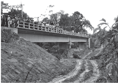
Puente Vehicular Zudáñez (Villa Tunari)

Este componente es el de mayor prioridad para el FONADAL. Su objetivo principal es la diversificación de la base productiva, para generar impactos positivos en los ingresos económicos de los beneficiarios, mediante proyectos basados en el enfoque de cadenas productivas, buscando generar su sostenibilidad en el proceso. Como ejemplo de éste componente se tiene: