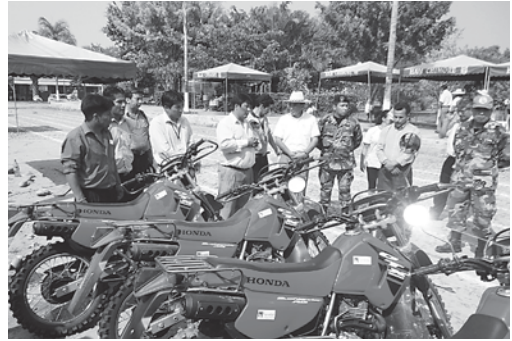
Entrega de motocicletas en Chimoré