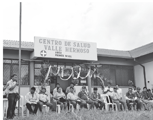
Centro de Salud en Puerto Villarroel

3. Componente temático de intervención de recursos naturales y medio ambiente. Este componente apoya a la preservación de los recursos naturales y medio ambiente. Como ejemplo de este componente se tiene: