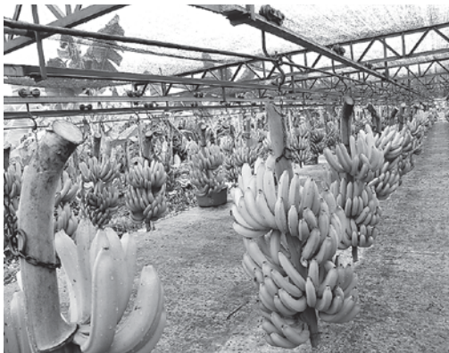
Cable vías en la Asociación de Villa Rosario (Puerto Villarroel)

2. Componente temático de intervención de desarrollo social. Este componente apoya a la mejora de los servicios de salud, educación, saneamiento básico,