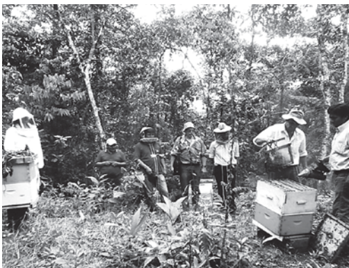
Proyecto de apoyo a la apicultura en el Trópico de Cochabamba

En el siguiente recuadro se muestran, a manera de resumen, los resultados del trabajo del FONADAL, como referentes del real impacto en la búsqueda de sus objetivos institucionales.