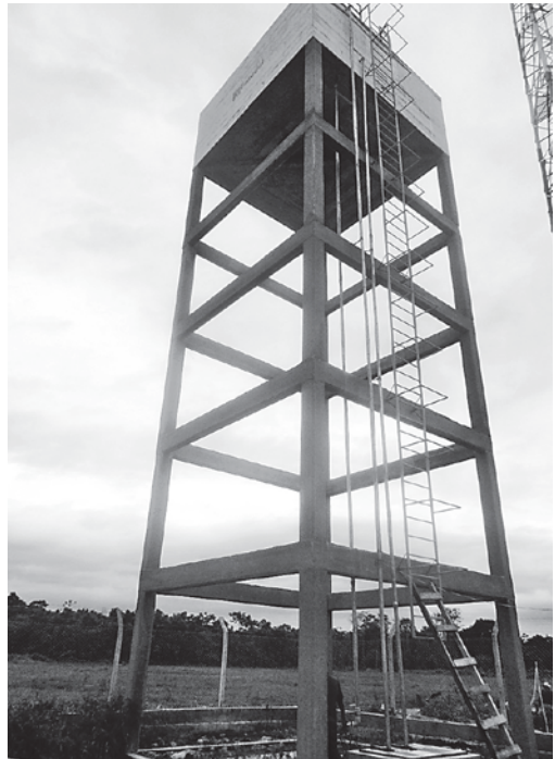
Tanque elevado del sistema de agua potable "Los Tajibos" (Entre Ríos).

electrificación, etc. Como ejemplo se tiene: