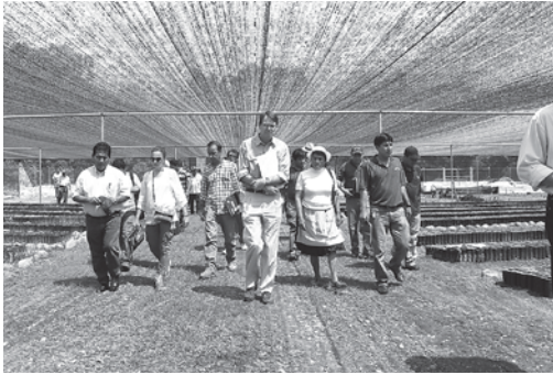
Vivero municipal Paracitito en el Municipio de Villa Tunari